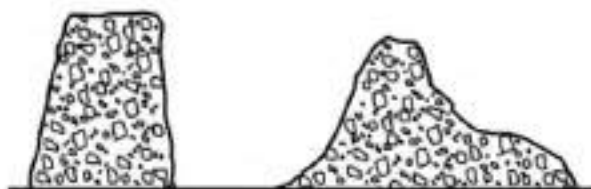
а) Равномерная осадка

Регистрируют равномерную осадку h , как показано на рисунке 1, с точностью до 10 мм.