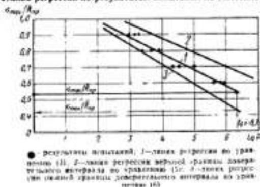
Линия регрессии по результатам испытаний на выносливость

коэффициент асимметрии цикла \mu_c = 0,1 ;