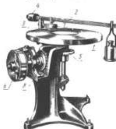
Круг истирания типа Беме

1 — истирающий диск; 2 — грузящий рычаг; 3 — образцы; 4 — противовес; 5 — зубчатая передача; 6 — шкив; 7 — держатель; 8 — счетчик оборотов