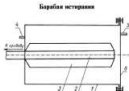
1 — барабан; 2 — под; 3 — крыльчатка; 4 — патрубок подачи воды; 5 — патрубок слива; 6 — съемная крышка

Шлифзерно 16 по ГОСТ 3647—80 или нормальный вольский песок по ГОСТ 6139—91.